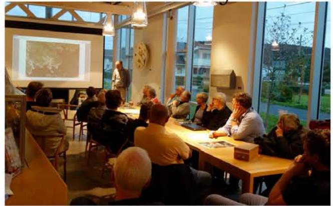
Historien om Åvik