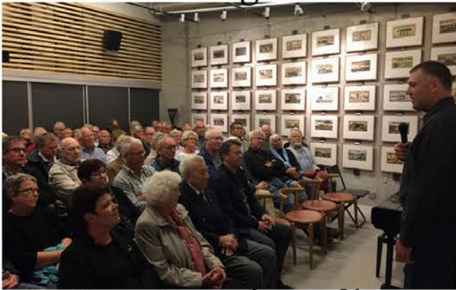
Søren Brandsnes film