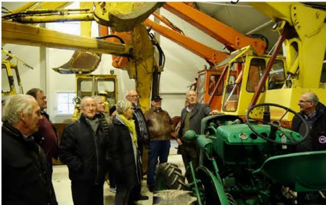
På Lindlands museum