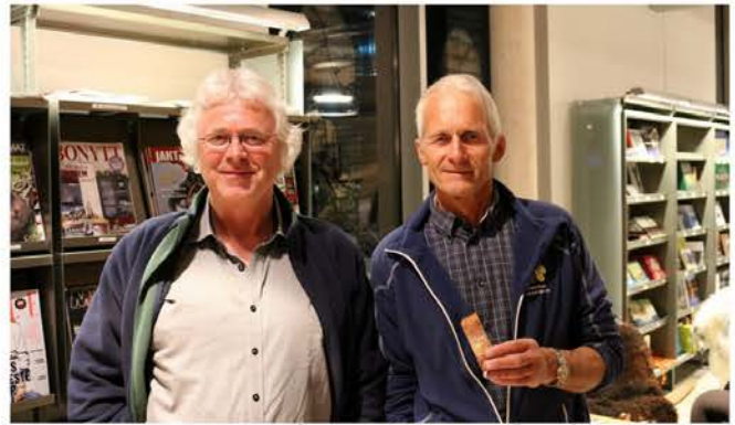
Om "Oliva" sitt forlis