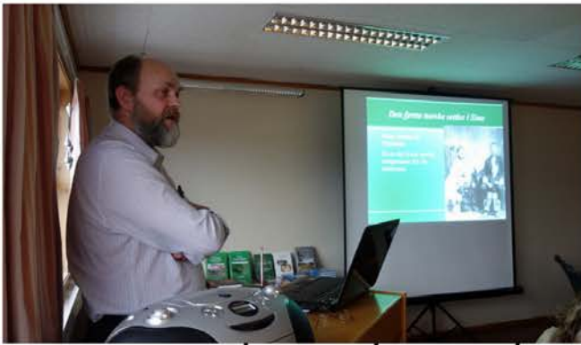
Om utvandring til Amerika